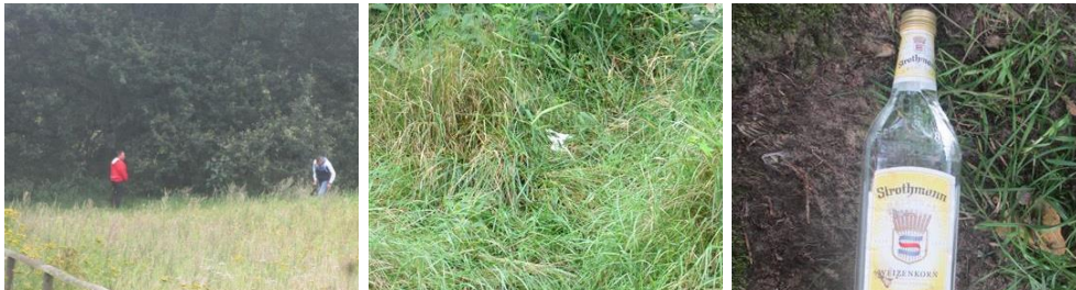
Abbildung 9: Urinieren, Fäkalien und Abfälle in Wetzen, Schnede und Garstedt

Hinterlassen von Abfällen und Ausscheidungen