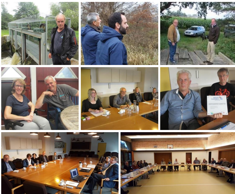
Abbildung 11: Impressionen aus dem Beteiligungsprozess

Kooperation ist Erfolgsfaktor Nummer eins