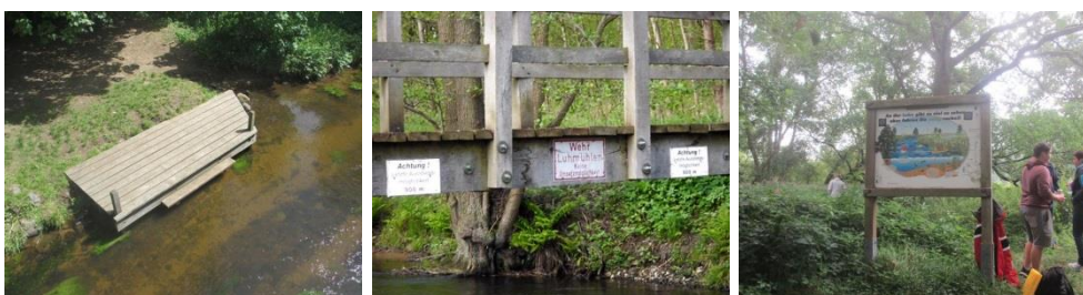
Abbildung 6: Beispiele für Mängel an Stegen und Schildern