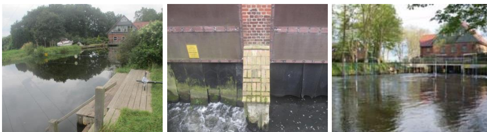
Abbildung 8: Umtragestelle am Wehr in Luhdorf