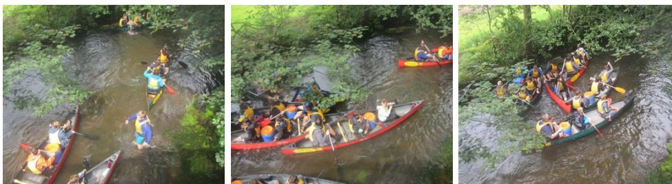
Abbildung 5: Beispiele für Probleme auf dem Wasser

Problematisch sind vor allem unerfahrene Kanuten in größeren Gruppen, häufig in Verbindung mit Alkohol