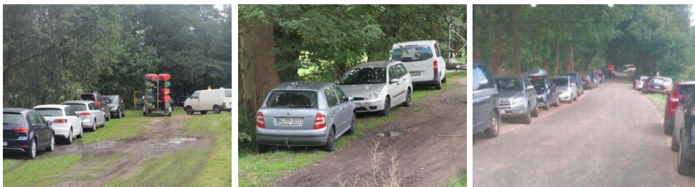
Abbildung 10: Parkraum in Wetzen, Luhmühlen und Garstedt