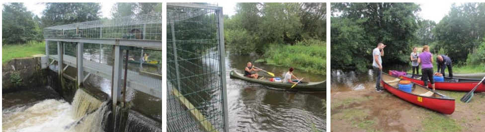
Abbildung 7: Umtragestelle am Wehr bei Schnede

Hinzu kommt, dass der infolge der Wasserentnahme für die Fischzucht geringere Wasserstand hinter dem Wehr Grundberührungen beim Wiedereinsetzen der Boote nahezu unvermeidlich machen. Dies macht sich bei ohnehin geringer Wasserführung oder einer zu großen Entnahmemenge besonders bemerkbar.