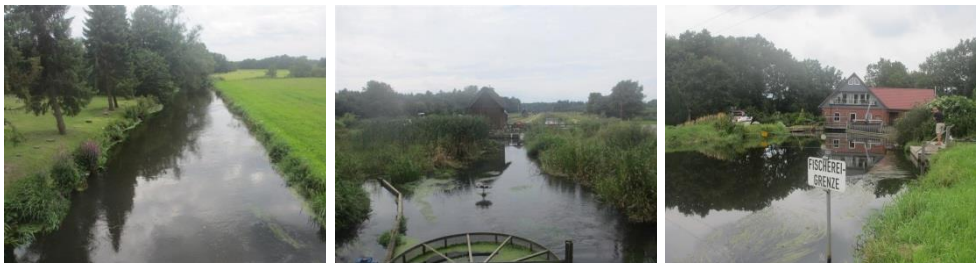
Abbildung 2: Wirtschaftliche Nutzungen am Mittellauf der Luhe

Entwässerung landwirtschaftlicher Flächen