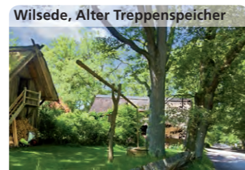
Wilsede, Alter Treppenspeicher