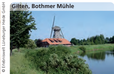
Gilten, Bothmer Mühle