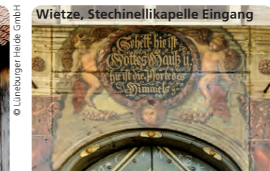
Wietze, Stechinellikapelle Eingang