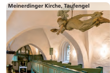
Meinerdingen Kirche, Taufengel