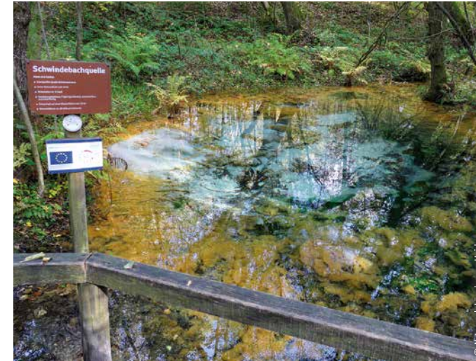
Die Schwindequelle ist die zweit wasserreichste Quelle in Niedersachsen.

Im großen Landschaftsschutzgebiet des Landkreises Lüneburg finden Besucher nahe Soderstorf ein schönes Fleckchen Heidelandschaft vor: die Schwindebecker Heide. Sie ist aber nicht die wichtigste Attraktion dieses Areals, obwohl sie zu schönen Spaziergängen einlädt – etwa auf dem Heide-Panorama-Wanderweg im Naturpark Lüneburger Heide. Statt der Heidelandschaft ist hier die Schwindequelle der Star. Ohne dezente Hinweise wie den Straßennamen „Zur Schwindequelle“ wäre sie wirklich gut versteckt. Sie liegt nahe der gleichnamigen Straße in einem Wäldchen, es geht ein paar Stufen abwärts. Dort angekommen, beeindruckt sie mit tollen Farbausfällungen und einem stetigen Wasseraustritt, der durch aufwirbelnden Sand am Boden des Quelltümpels erkennbar ist.