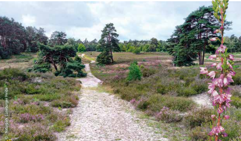
Die Schwindebecker Heide war einst vom militärischen Übungsbetrieb betroffen. Heute ist davon nichts mehr zu sehen.

Wer in die nahe gelegene Schwindebecker Heide wandert, findet dort Farbenspiele anderer Art. Die Besenheide blüht im August und September verlässlich purpur. Im Winterhalbjahr sorgt der braun gewordene Zwergstrauch für den typisch rauen Charme von Heidelandschaften. Farbtupfer streuen zu passender Jahreszeit die gelben Blüten von Rainfarn und Johanniskraut ein. Bis 1990 sah es hier ganz anders aus. Das Gebiet wurde infolge des Zweiten Weltkriegs über Jahrzehnte militärisch genutzt. Heute ist das Areal ein gelungenes Beispiel für die Revitalisierung von Heideflächen. Die Osterheide bei Schneverdingen trug ein ähnliches Schicksal – auch hier mit Happy End.