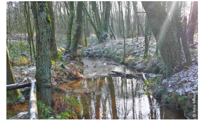
Der Schwindebach fließt an der Schwindequelle vorbei – sie speist den Bach nicht von Beginn an.

Die Schwindequelle ist eine Tümpelquelle.