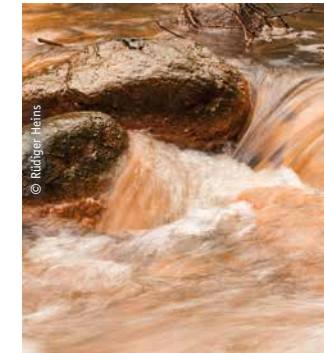
Wasser – Quell des Lebens.

In Zeiten ohne Trinkwasserleitungen dürfte das saubere klare Wasser von Quellen unbeschreiblich wichtig gewesen sein. Dort konnten Mensch und Tier ihren Durst stillen. Quellen frieren nicht zu und sind verlässliche Lebenskraft. Kein Wunder, dass sie Kultstatus erlangten.